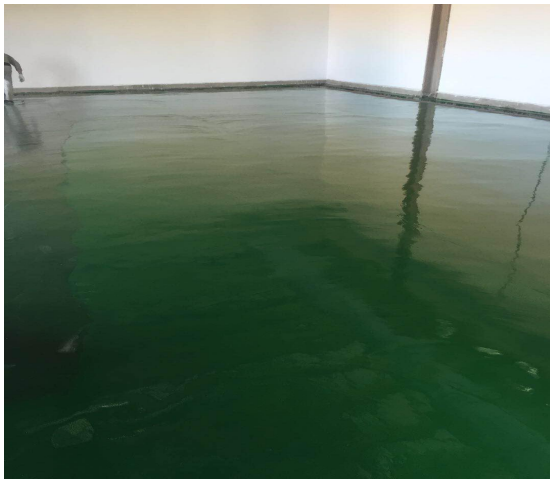
危废间及化学品库防渗工程的照片